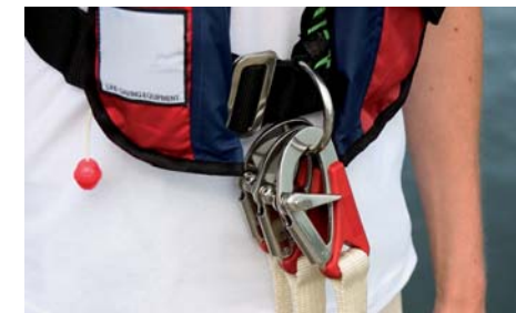
D-ring og livliner

Søsportens Sikkerhedsråd anbefaler, at man til al fritidssejls køber en vest med indbygget sikkerhedssele med D-ring og tilhørende CE-godkendt livline samt skridtrem.